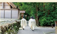
日別朝夕大御饌祭(参進)