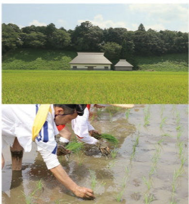
伊勢神宮の田んぼ 神様のためにいっしょうけんめいお米を育てます

伊勢神宮のお祭りで中心となられるのは、天皇陛下。天皇陛下はいつも私たちみんなの幸せをおいのりされているんだ。お祭りでは