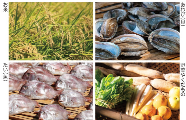
神様へ色々なおそなえもの 全て神様のおめぐみによって自然からいただいたものです