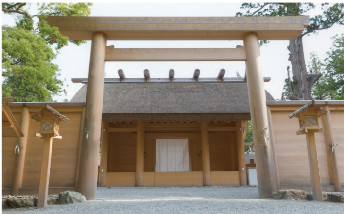
豊受大御神をおまつりしています 豊受大神宮(外宮)