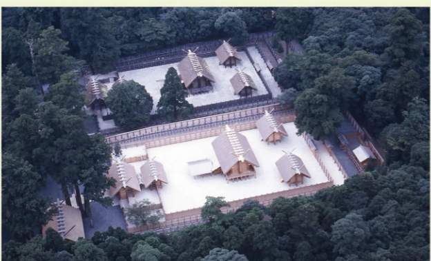
となりに出来た新しい神社 神様にお引つこしをしてもらいます

ごはんを思い出してごらん。お茶わんのごはんは神様のお力をいただいて農家の人がいっしょうけんめい育ててやっとしゅうかくすることが出来たお米だ。ごはんの前に言う「いただきます」は神様やお米を作ってくれた人、料理をしてくれた人みんなへのお礼であることをわすれないでほしい。