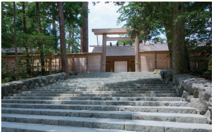
天照大御神をおまつりしています 皇大神宮(内宮)