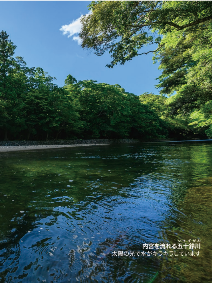
いすずがわ 内宮を流れる五十鈴川 太陽の光で水がキラキラしています

きみが食べているもの、着ているもの、 住んでいるところ、そこにどんな にたくさんの人たちが関わっている か考えたことがあるかい？ そのよ うな人たちのおかげできみたちは毎日 安心して過ごすことが出来るんだ。そ して、目には見えないけれど、きみた ちをささえてくれているもつと大切 なものがある。人の愛じょうや信ら い関係だ。それとにているもので、少 し考えないと分からないものが神様の おめぐみ。それは神様からわたしたち 全ての生き物への愛じょうだよ。きみ たちの中には神様からいただいた命