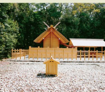
倭姫宮と古殿地(手前)

(七四七)に第四回内宮遷宮が斎行され、同年十二月に「諸別宮遷し奉りて二十年に二度の御遷宮、長例の宣旨了んぬ」との記載があり、奈良時代には現在と同じように、別宮も式年遷宮が行われていました。第六十二回神宮式年遷宮は平成二十五年秋、両正宮とそれぞれの第一別宮で行われ、倭姫宮でも、平成二十六年十二月に式年遷宮が行われました。現在の殿舎は東側の御敷地にあり、西側は古殿地となっています。